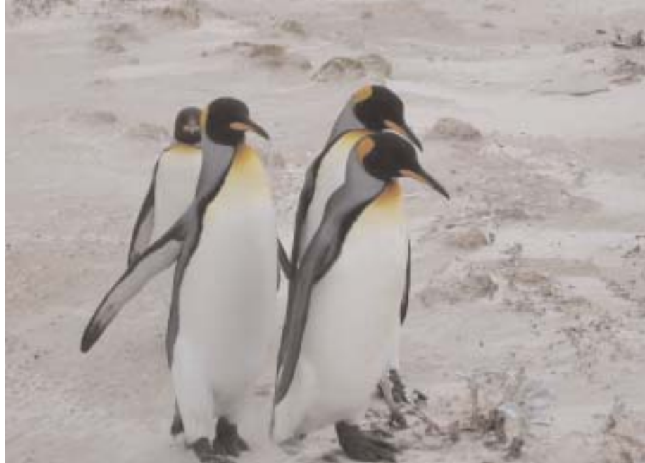
Falklandski pingvini glavni su kupaći na Gypsy Coveu , jednoj od najljepših plaža svijeta