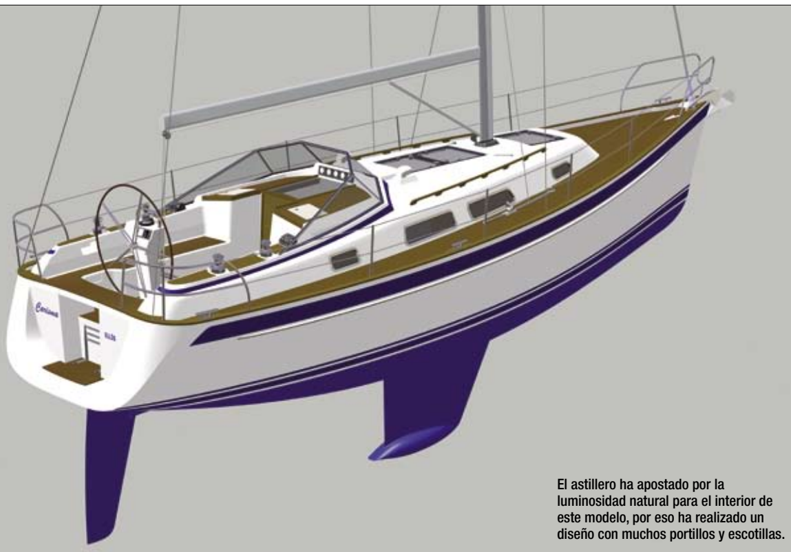
El astillero ha apostado por la luminosidad natural para el interior de este modelo, por eso ha realizado un diseño con muchos portillos y escotillas.

La cabina del armador se sitúa en proa y es generosamente amplia, equipada con una gran cama, dos amplios armarios, dos tocadores y un cómodo sofá. La cabina de popa también tiene una cómoda y excepcionalmente amplia cama doble.