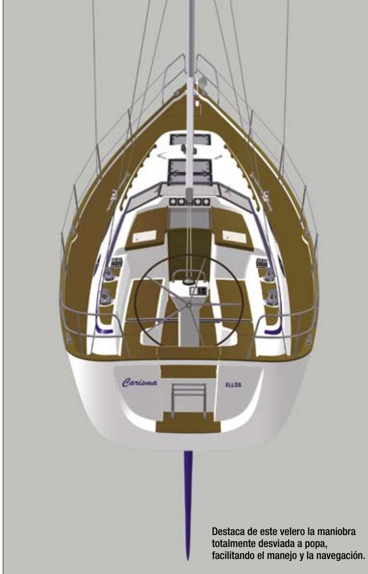
Destaca de este velero la maniobra totalmente desviada a popa, facilitando el manejo y la navegación.

A estribor se encuentra la mesa de cartas enfrente de la cocina, con un confortable asiento y una práctica mesa, ambos con capacidad de estiba, y el cuadro eléctrico a mano derecha en la pared. Siguiendo hacia popa, el único baño, decorado en blanco laminado, sorprende por una ducha independiente con mamparas de Plexiglass, un gran espejo y un práctico armario muy completo. Este surtido baño se ventila a través de una escotilla de cubierta y un portillo lateral.