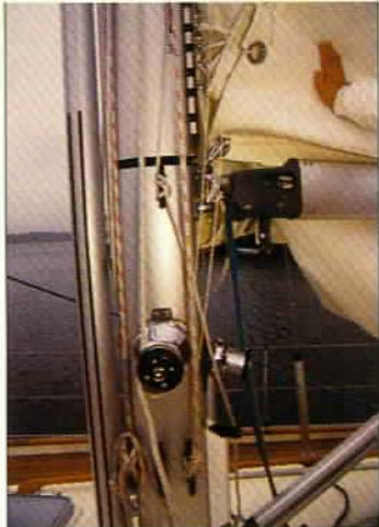
Fall og rev er ført til selvsjøtende vinsjer.

Forpiggene er også rommelige, men dobbeltkøyene er bare 40 cm brede helt fremme. De er dessuten høye å klatre opp i.