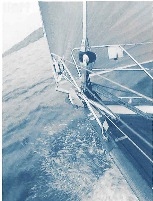
Löstagbart rostfritt gennakerbogspröt