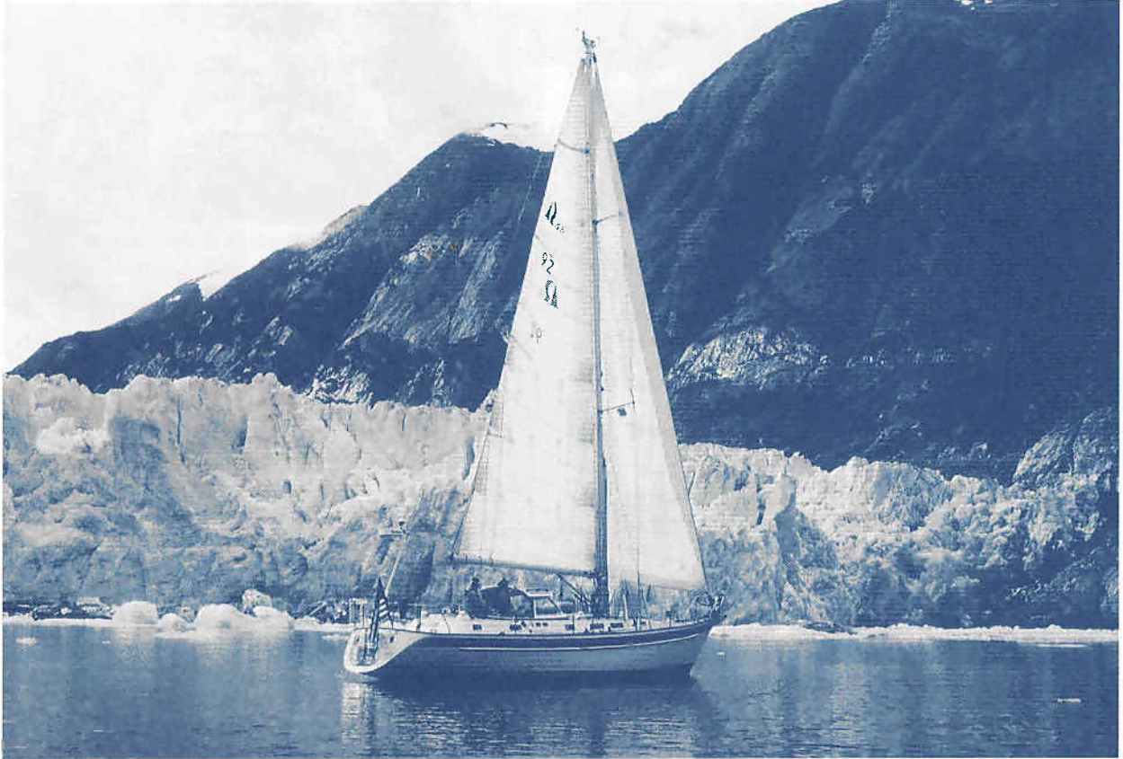
En Hallberg-Rassy platsar över hela jorden, i alla klimat. Här en HR 46 i Alaska.